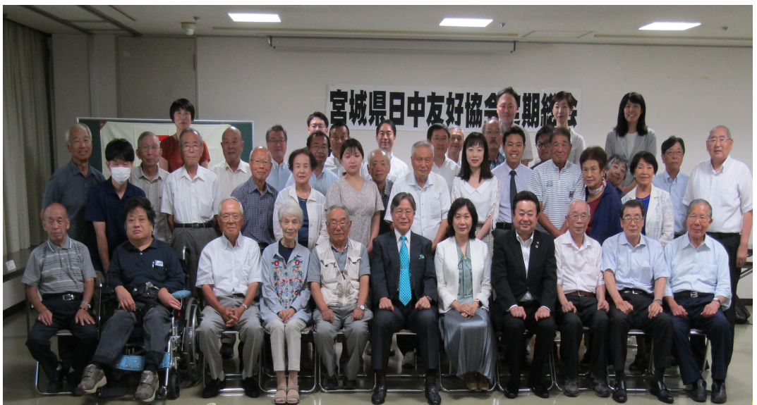
定期総会記念写真