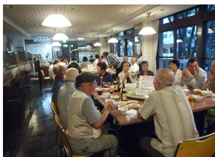
和気あいあいの懇親会